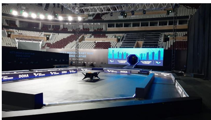
Foto: Takto vyzerá hrací kurt WTT v Katare