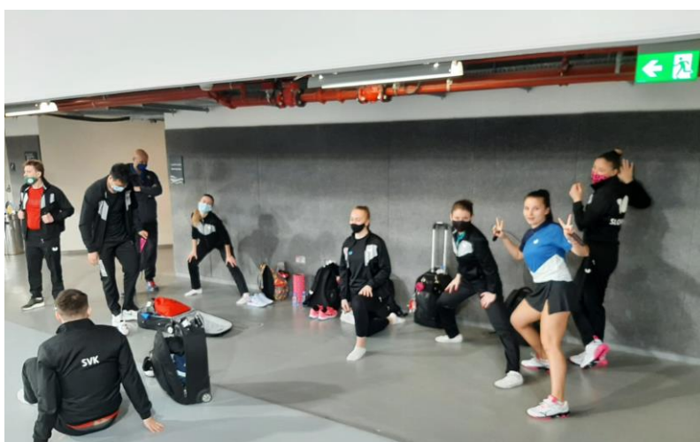
Foto: Slovenská výprava pred prvým tréningom

V sobote popoludní sa uskutočnilo žrebovanie, ktoré však sprevádzal chaos a nezrovnalosti. V pavúku sa ocitli hráči, ktorí sa medzitým odhlásili, alebo naopak, chýbali v ňom niektorí prihlásení. Zaradiť napríklad zabudli aj Wanga s Kukul'kovou do mixu... "Je to až neuveriteľné, aké problémy boli s vyžrebovaním. Celé to bolo na amatérskej úrovni.