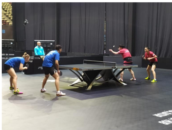
Foto: T. Kukul'ková spolu s Y. Wangom v miešanej štvorhre.

Autor článku: Ľuboš Bogdányi Bratislava, 28.2.2021